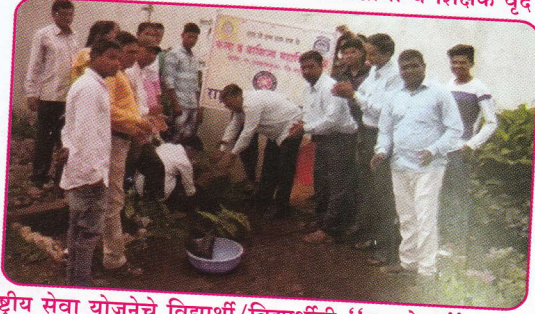
राष्ट्रीय सेवा योजनेचे विद्यार्थी/विद्यार्थीनी "वृक्षारोपन" करतांना