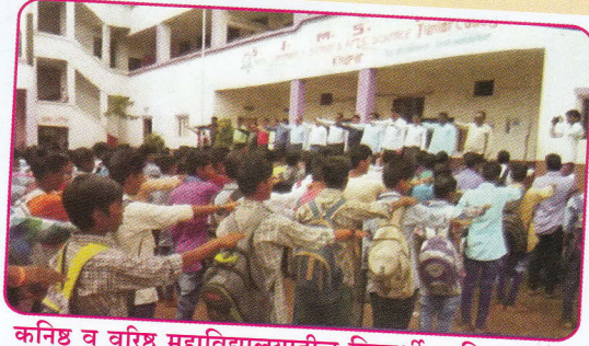
कनिष्ठ व वरिष्ठ महाविद्यालयातील विद्यार्थी व शिक्षक वृंद